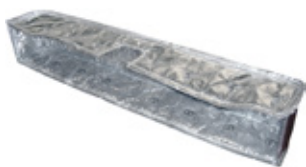
PAKOSARJAN ERISTEET - Max lämpötila 1250°C

Eristystuotteemme on valmistettu kuumankestävistä materiaaleista, joiden maksimi lämpötila on 1250°C. Pintamateriaaleissa löytyy lukuisia eri vaihtoehtoja käyttötarkoituksen mukaan. Eristeisiin on valittavissa joko solki tai koukku kiinnitykset.