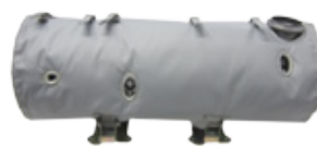
SCR-JÄRJESTELMÄN ERISTEET - Max lämpötila 1250°C