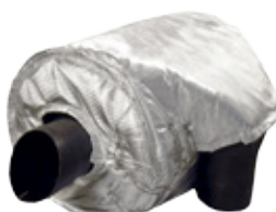
KATALYSAATTORIN JA ÄÄNENVAIMENTIMEN ERISTEET - Max lämpötila 1250°C