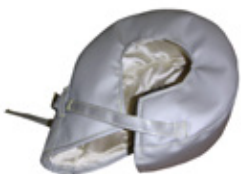
TURBON ERISTEET - Max lämpötila 1250°C