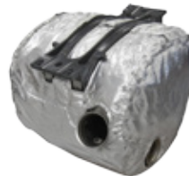
DPF:N ERISTEET - Max lämpötila 1250°C